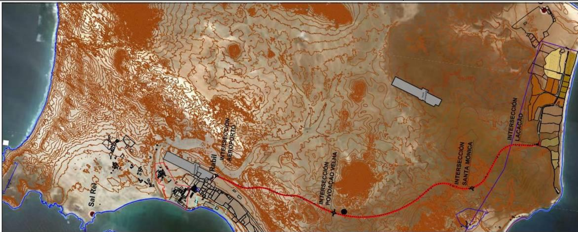
Plano 2. Planta General de las obras